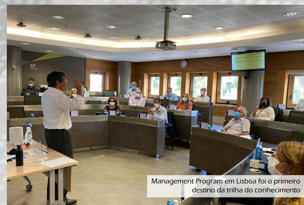
Management Program em Lisboa foi o primeiro destino da trilha do conhecimento

Já o curso Prime Coop Management Program foi realizado de 22 a 26 de novembro na Trinity College Dublin, a mais