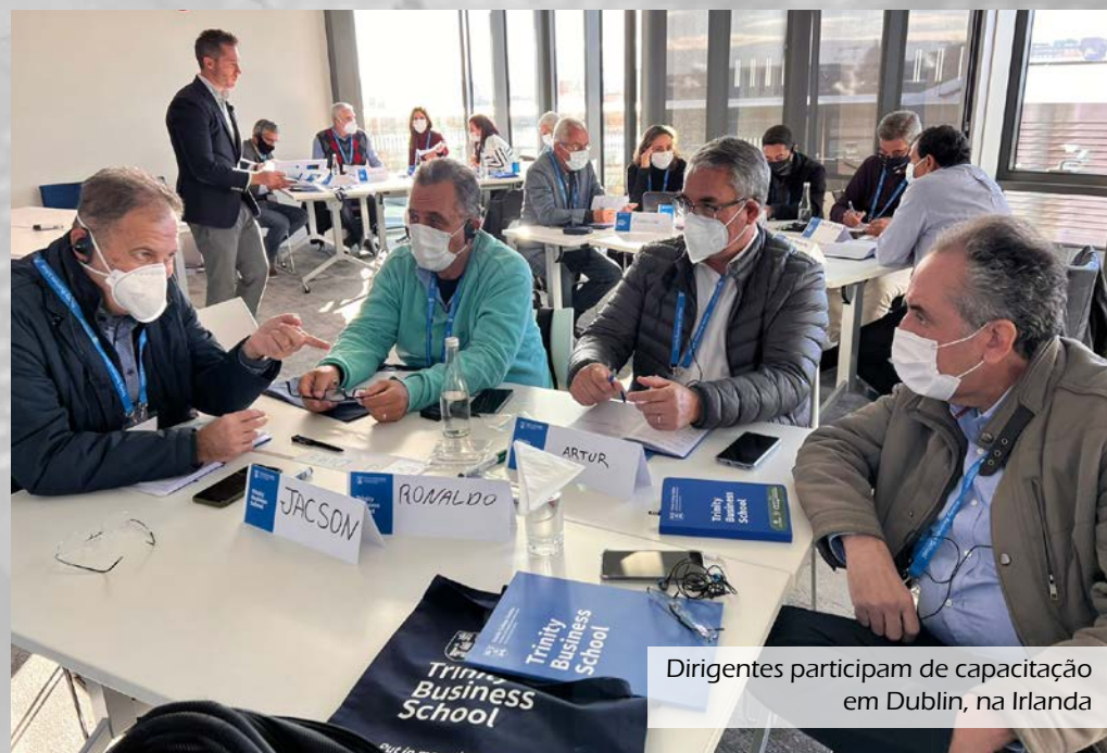
Dirigentes participam de capacitação em Dublin, na Irlanda

Gestores de cooperativas mineiras passam por trilha do conhecimento em programas realizados em parceria com renomadas instituições de ensino nacional e internacionais