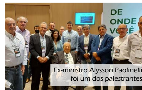
Ex-ministro Alysson Paolinelli foi um dos palestrantes

Entre os dias 16 e 17 de novembro, a cidade de Campinas (SP) sediou o Encontro Nacional das Cooperativas Agropecuárias (ENCA). Em 2021, o evento foi realizado em formato híbrido, devido a pandemia de Covid-19.