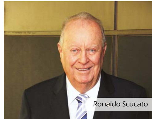
Presidente do Sindicato e Organização das Cooperativas do Estado de Minas Gerais (Ocemg) e do Serviço Nacional de Aprendizagem do Cooperativismo (Sescoop-MG)

No retrovisor estão todas as nossas conquistas, mas diante de nós estão todas as possibilidades do porvir, uma estrada longa e um caminho que continuará sendo trilhado em