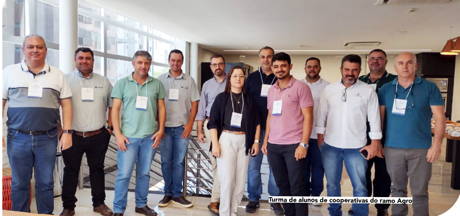
Turma de alunos de cooperativas do ramo Agro