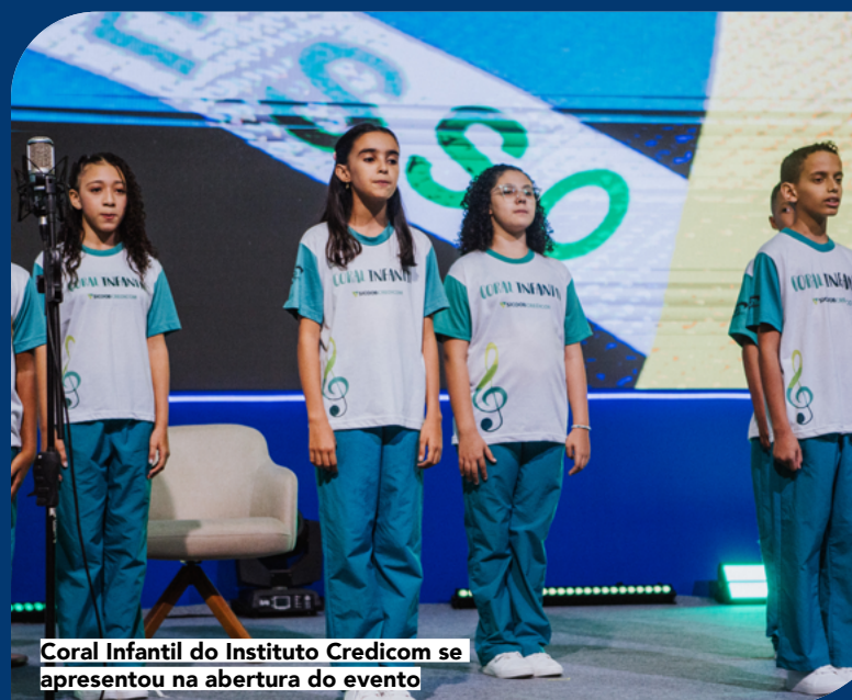
Coral Infantil do Instituto Credicom se apresentou na abertura do evento

O presidente do Sistema Ocemg, Ronaldo Scucato, avalia que o evento serviu de alerta para as cooperativas em relação ao futuro. “As perspectivas tratadas são da