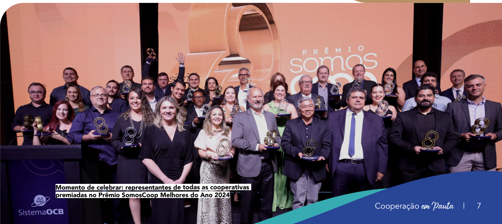
Momento de celebrar: representantes de todas as cooperativas premiadas no Prêmio SomosCoop Melhores do Ano 2024

Sicoob Credialto (Bronze) Projeto: “IntenseFIC”